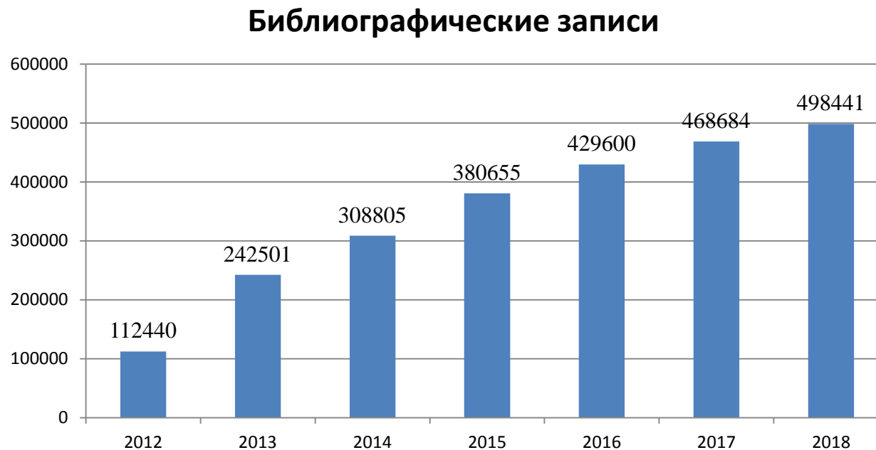
Рисунок 2 – Объем Сводного каталога государственных и муниципальных библиотек Кузбасса (количество библиографических записей)

Эффективность деятельности данного направления проиллюстрировано диаграммой: